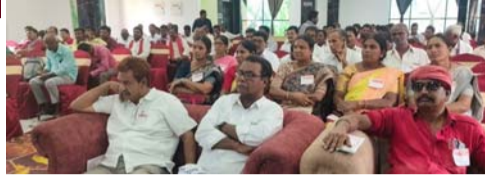
బదులుగా ప్రభుత్వం ఓటర్లను ఎంపిక చేసే పరిస్థితికి దేశాన్ని నెట్టివేస్తోందన్నారు. బీజేపీ విధానాలకు వ్యతిరేకంగా ప్రజాస్వామ్య శక్తులన్నీ ఐక్యంగా ఉద్ధమించాలని పిలుపునిచ్చారు. కేంద్ర ప్రభుత్వం తమ ఇష్టానుసారం పెట్రోల్, డీజిల్, వంట గ్యాస్ ధరలను పెంచుతుందని ఆరోపించారు. ఇప్పటికే యుద్ధాల మూలంగా ప్రజలపై భారాలు పడి ఇబ్బంది పడుతున్న ప్రజలపై మునిగే సక్రమ తాటిపండు వడ్డ చందంగా ఇంధన యిల్ల ధరలు పెంచడం సమంజసం కాదన్నారు. ధరల నియంత్రణకు చర్యలు చేపట్టాలన్నారు. ఇటీవల జరిగిన ఐదు రాష్ట్రాల ఎన్నికల ముందు లాలాచీ గ్యాస్, పెట్రోల్, డీజిల్ ధరలు పెంచమని చెప్పి రోజు విడిచి రోజు

రాజ్యాంగం కల్పించిన ఓటర్ల జాబితా ప్రత్యేక (ప్రవీకరణ) పేరుతో మైనారిటీలు, దళితులు, ఆదివాసీల ఓటర్లు తొలగించే ప్రయత్నం జరుగుతోందని సీపీఐ(ఎం) రాష్ట్ర కార్యదర్శి వర్గ సభ్యుల ముఖ్య అధ్యక్షులు ఆరోపించారు. బుధ వారం సూర్యాపేట జిల్లా కేంద్రంలోని స్టార్ బ్యాంక్ ఎల్ హాల్ రెండు రోజులపాటు జరిగే సీపీఐ (ఎం) పార్టీ సూర్యాపేట జిల్లాస్థాయి రాజకీయ శిక్షణ తరగతులను ఆమె ప్రారంభించి, మాట్లాడుతూ ప్రవీకరణ పత్రాల లేమి కారణంగా పేద ప్రజలు ఓటర్ల జాబితాలో కోల్పోయే ప్రమాదం ఉందన్నారు. ఎన్నికల ప్రక్రియను రాజకీయ ప్రయోజనాలకు ఉపయోగించుకోవాలని బీజేపీ చూస్తోందని విమర్శించారు. ప్రజలు ప్రభుత్వాలను ఎన్నుకునే ప్రజాస్వామ్య విధానానికి