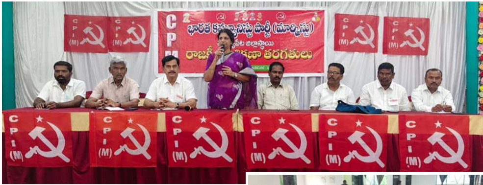
సీపీఐ(ఎం) రాష్ట్ర కార్యదర్శి వర్గ సభ్యుల ముఖ్య అధ్యక్షులు సూర్యాపేట జూన్ 3 మనసాక్షి

రాజ్యాంగం కల్పించిన ఓటర్ల జాబితా ప్రత్యేక (ప్రవీకరణ) పేరుతో మైనారిటీలు, దళితులు, ఆదివాసీల ఓటర్లు తొలగించే ప్రయత్నం జరుగుతోందని సీపీఐ(ఎం) రాష్ట్ర కార్యదర్శి వర్గ సభ్యుల ముఖ్య అధ్యక్షులు ఆరోపించారు. బుధ వారం సూర్యాపేట జిల్లా కేంద్రంలోని స్టార్ బ్యాంక్ ఎల్ హాల్ రెండు రోజులపాటు జరిగే సీపీఐ (ఎం) పార్టీ సూర్యాపేట జిల్లాస్థాయి రాజకీయ శిక్షణ తరగతులను ఆమె ప్రారంభించి, మాట్లాడుతూ ప్రవీకరణ పత్రాల లేమి కారణంగా పేద ప్రజలు ఓటర్ల జాబితాలో కోల్పోయే ప్రమాదం ఉందన్నారు. ఎన్నికల ప్రక్రియను రాజకీయ ప్రయోజనాలకు ఉపయోగించుకోవాలని బీజేపీ చూస్తోందని విమర్శించారు. ప్రజలు ప్రభుత్వాలను ఎన్నుకునే ప్రజాస్వామ్య విధానానికి