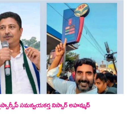
రామసముద్రం మే 16 మనసాక్షి