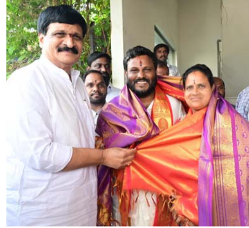
లోక కళ్యాణార్థం నీలం కవిత మధు దంపతుల సంకల్పం