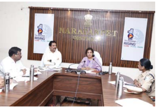
జిల్లా కలెక్టర్ సీ హెచ్ ప్రయాంశ్. నారాయణపేట టౌన్, మే 16 మనసాక్షి :-

భవిష్యత్తులో వచ్చే ప్రకృతి విపత్తులను ఎదుర్కొనేందుకు జిల్లా యంత్రాంగం కార్యాచరణను సిద్ధం చేసుకున్నట్లు జిల్లా కలెక్టర్ సీ హెచ్ ప్రయాంశ్ తెలిపారు. పర్యావరణ విపత్తులను ఎలా ఎదుర్కోవాలి? ఎలా సన్నద్ధం కావాలని శనివారం జిల్లా కలెక్టరేట్ లోని వీసీ హాల్ లో అన్ని ప్రభుత్వ శాఖల అధికారులతో జిల్లా కలెక్టర్ సమన్వయ సమావేశం నిర్వహించారు. ఈ సందర్భంగా కలెక్టర్ మాట్లాడుతూ జిల్లాలోని మత్తల్ నియోజక వర్గం కృష్ణానది లో ప్రవాహం పెరిగి వరదలు, వరద ఉద్భవించే ప్రమాదం ఉంటుందని, గత అనుభవాలను దృష్టిలో ఉంచుకొని, భవిష్యత్తులో ప్రమాదాల సంభవిస్తే ప్రాణ, ఆస్తి నష్టం జరగకుండా ఆయా ప్రభుత్వ శాఖలు ఏ విధంగా స్పందించాలి? తీసుకోవాల్సిన ముందస్తు కార్యాచరణ ఏమిటి అన్నవిని చర్చించారు. సమావేశంలో రూపొందించుకున్న కార్య చరణతో ఈ నెల 18 న