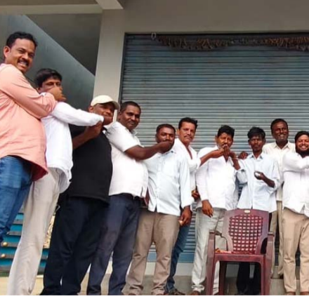
వెల్లండ్ మే 16 మనసాక్షి