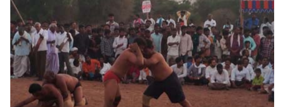
కంగ్లి, ఏప్రిల్ 09, మన సాక్షి