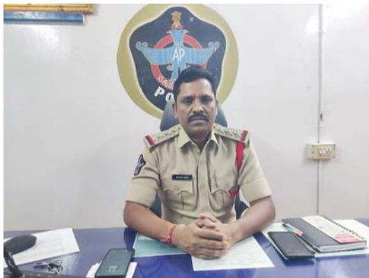
పటానెరు, ఏప్రిల్ 09, మన సాక్షి

అన్నమయ్య జిల్లా రామనమల మండల పోలీస్ స్టేషన్ ను గురువారం మందపల్లి రూరల్ సీబి రవి నాయక్ సందర్శించారు. పోలీస్ కార్యాలయంలో పలు కేసుల రికార్డులను పరిశీలించారు. ఆయన మాట్లాడుతూ ప్రతి ఒక్క ద్వైపకదారులు హెల్మెట్ ధరించి ప్రాణాలను రక్షించుకోవాలన్నారు. హెల్మెట్ ధరించకుండా వాహనం నడిపితే 1035 జరిమానా విధిస్తామని మైసర్లకు వాహనాలు ఇస్తే తల్లి దండ్రులు పై కేసులు నమోదు చేసి జరిమానా విధిస్తామని హెచ్చరించారు. ఎవ్వరైనా రోడ్డు ప్రమాదంలో గాయపడిన వారిని సకాలంలో దగ్గరలో ఉన్న ఆసుపత్రికి తరలించి ప్రథమ చికిత్స అందించాలని, కేంబ్రోప్రభుత్వం ఈ మధ్యనే జీవో మంజూరు చేశారని గాయపడిన వారిని ఆసుపత్రికి తరలిస్తే ప్రభుత్వం వారికి ప్రోత్సాహాలు అందించడం జరుగుతుందని ఎక్కువ సార్లు కాపాడిన వ్యక్తులకు ఆవార్డ్ తో సత్కరించడం జరుగుతుందన్నారు. ఇంటర్, పదవ తరగతి పరీక్షల ముగిసిన నేపథ్యంలో తల్లి దండ్రులు పిల్లలపై ప్రత్యేక ద్రుష్టి పెట్టాలని పిల్లలు చెరువులు బావులు దగ్గరకి వెళ్తున్నారని వెళ్లే ముందు జాగ్రత్తగా ఉండాలని పిల్లలకు చెప్పాలని, ఉపాధి హామీ పథకం ద్వారా చెరువుల్లో లోతుగా గుంతలు పెట్టారని వాటి లోతులను కోవాలని తండ్రులు పిల్లలని ఈతకి తీసికెళ్ళాలన్నారు.