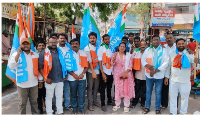
గోదావరిఖని, ఏప్రిల్ 09, మన సాక్షి