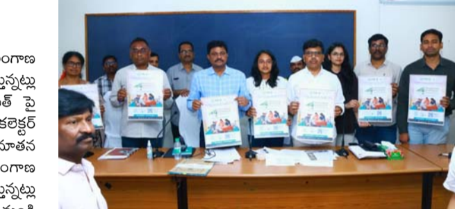
వ్యక్తిగత, మార్గదర్శకత్వం పై సలహాలు పొందేందుకు ఇది ఒక గొప్ప అవకాశంగా భావించి ఈ అవకాశాన్ని యువత సద్వినియోగం చేసుకోవాలని ఆయన కోరారు. రాష్ట్ర రాజధాని వెలుపల ఉన్న వ్యవస్థాపకులు, ఆవిష్కరణ వనరులు సమానంగా అందుబాటులో ఉండేలా, తక్షణ మరియు స్పష్టమైన సహాయాన్ని అందించడానికి ఈ కార్యక్రమాన్ని తీర్చిదిద్దారని ఈ కార్యక్రమంలో పాల్గొన్నవారు, నిపుణులతో