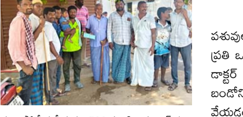
వెల్లం ఏప్రిల్ 06 మన సాక్షి