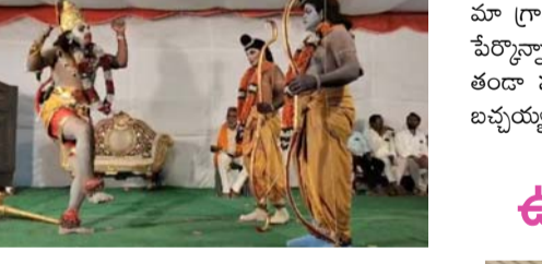
కరీంనగర్, ఏప్రిల్ 06, మనసాక్షి :