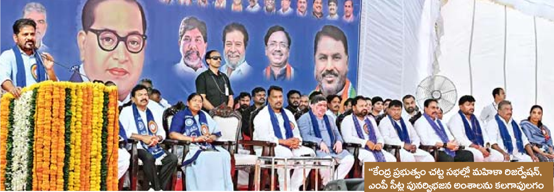
“కేంద్ర ప్రభుత్వం చట్ట సభల్లో మహిళా లిజిస్లేషన్, ఎంపీ సీట్ల పునర్విభజన అంశాలను కలగాపులగం చేసాకంది. ఇప్పుడు ప్రతిపాదిస్తున్న పునర్విభజన తీరు వల్ల దక్షిణాది రాష్ట్రాల్లో ఎస్సీ, ఎస్టీలు, మహిళలకు అన్యాయం జరుగుతుంది.

నల్గొండ హైదరాబాద్ సంపుటి : 4. సంచిక : 208 బుధవారం 15 ఏప్రిల్ 2026 పేజీలు 8 వెల: రూ. 1.00 epaper.manasakshi.in