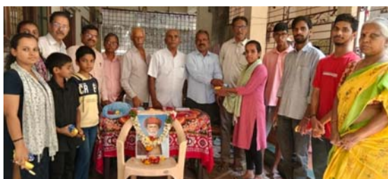
శేరిలింగంపల్లి, ఏప్రిల్ 11, మన సాక్షి: