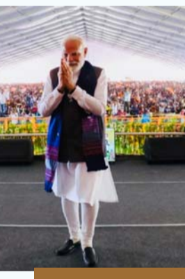
అందుకు బిజెపిపై దాడులకు తెగిస్తున్నారు బెంగాల్ ప్రచార సభలో ప్రధాని మోడీ

కోల్కతా: పశ్చిమ బెంగాల్లో భారతీయ జనతా పార్టీకి పెరుగుతున్న ప్రజా మద్దతును చూసి తృణమూల్ కాంగ్రెస్ (టీఎంసీ) భయాందోళనలో ఉందని ప్రధానమంత్రి నరేంద్ర మోడీ అన్నారు. శనివారం రాష్ట్రంలో జరిగిన ఒక బహిరంగ సభలో పాల్గొన్న మోడీ, ప్రస్తుత అధికార పార్టీ తీరుపై తీవ్రస్థాయిలో విరుచుకుపడ్డారు. రాష్ట్రంలో బీజేపీకి లభిస్తున్న ఆదరణను చూసి మమతా బెనర్జీ నేతృత్వంలోని ప్రభుత్వం భయాందోళనలకు గురవుతోందని ప్రధాని పేర్కొన్నారు. ఓటమి భయంతోనే టీఎంసీ నేతలు అరాచకాలకు పాల్పడుతున్నారని ఆయన విమర్శించారు. బీజేపీ అధికారంలోకి వస్తే మహిళలకు భద్రత కల్పిస్తామని, రాజకీయ హింసలో పాల్గొన్న వారిపై చర్యలు తీసుకుంటామని ఆయన తెలిపారు. పూర్వ బిర్మాన్లో జరిగిన ఎన్నికల రౌలీల్లో ప్రధాని మాట్లాడుతూ.. 'పశ్చిమ బెంగాల్ నుంచి చొరబాటుదారులందరినీ తరిమేస్తాం. అలాంటి వారికి మద్దతునిచ్చి, వారు ఇక్కడ స్థిరపడటానికి సహాయపడేన వారిపై కూడా చర్యలు తీసుకుంటాం. అమాయక ప్రజలపై, రాజకీయ ప్రత్యర్థులపై దాడులకు పాల్పడిన వారిని చట్టం ముందు నిలబెడతాం. అవినీతి, శాంతిభద్రతలపై శ్వేతపత్రాన్ని విడుదల చేస్తాం. ప్రతి టీఎంసీ గూండా, సిండికేట్, అవినీతిపరుడైన ఎమ్మెల్యే లేదా మంత్రిపై చట్టప్రకారం చర్యలు తీసుకుంటాం. రాజకీయ హింసపై విచారణ జరిపేందుకు, విశ్రాంత సుప్రీంకోర్టు న్యాయమూర్తి నేతృత్వంలో ఒక విచారణ కమిషన్ను ఏర్పాటు చేస్తాం.'