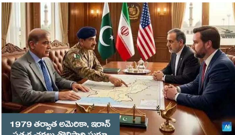
1979 తర్వాత అమెరికా, ఇరాన్ ప్రత్యక్ష చర్చలు తొలిసారి ఘరూ

'అమెరికా ఫస్ట్' అయితే దీల్లోకి సిద్ధం అడ్డుకుంటే దొనాల్డో ట్రంప్ ని నానాదమైన 'అమెరికా ఫస్ట్'కు ఆ దేశం కట్టుబడి ఉంటే అమెరికాతో ఒప్పందానికి సిద్ధమని ఇరాన్ ఉపాధ్యక్షుడు రిజా అలీఖాన్ స్పష్టం చేశారు. ఇజ్రాయేల్ ఫస్ట్ అంటే మాత్రం ఒప్పందానికి అంగీకరించబోమని పేర్కొన్నారు. చర్చలు విఫలమైతే ప్రపంచం భారీగా నష్టపోవాల్సి వస్తుందని హెచ్చరించారు.