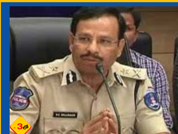
వాటర్ బిల్లు బకాయిల పేరుతో మెసేజ్లు