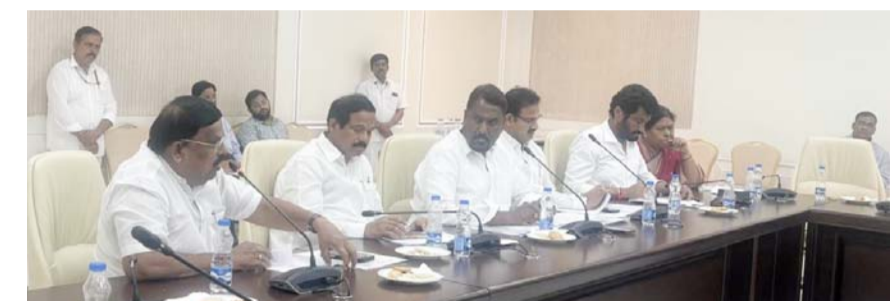
చింతపల్లి, ఏప్రిల్ 08, మన సాక్షి: