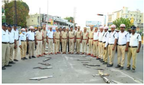
మాట్లాడుతూ.. ద్వీచక్ర వాహనదారులు కంపెనీ ద్వారా అందించిన ఒరిజినల్ సైలెన్సర్లను మాత్రమే వినియోగించాలని సూచించారు. సైలెన్సర్లలో అనుమతి లేకుండా మార్పులు చేసి అధిక శబ్దం కలిగించే విధంగా ఉపయోగిస్తే సంబంధిత వ్యక్తులపై క్రిమినల్ కేసులు నమోదు చేయడం జరుగుతుందని హెచ్చరించారు. అలాగే తిరిగి మాడిఫైడ్ సైలెన్సర్లు