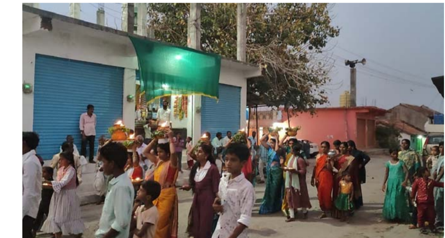
కర్కెడ్డి, ఏప్రిల్ 08, మన సాక్షి:-

కంగ్లి మండల తద్యల్ లో రేణుక ఎల్లమ్మ తల్లి భారీ ఎత్తున మహిళలు బోనాల తీశారు. బుధవారం బోనాల పండుగ సందర్భంగా ఆలయంలో అమ్మవారికి కుంకుమార్చన, అభిషేకం, హారతి తదితర వూజులు నిర్వహించారు. గ్రామంలోని ప్రధాన వీధుల గుండా నిర్వహించిన శోభయాత్రలో దమ్మ వాయిద్యాల హోర, నృత్యాలు ఆకర్షణగా నిలిచాయి. ఆనంతరం అమ్మవారికి బోనాలు వైవేద్యాలు సమర్పించి ఒడి బిర్యాన్ని పోసి, పాడి పంటలు బాగా పండి పిల్ల బిల్లాపాలతో ప్రజలందరూ సుఖంతోపోవాలి అమ్మవారిని వేడుకున్నారు. గురువారం కన్నీ పోటీలు ఉంటాయని నిర్వాహకులు తెలిపారు.