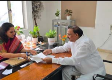
నియోజకవర్గంలో నెలకొన్న పలు ప్రజా సమస్యలు అభివృద్ధి కార్యక్రమాలపై ఎమ్మెల్యే ఆరెకపూడి గాంధీ మాధాపూర్లోని సైబరాబాద్ మున్సిపల్ కార్పొరేషన్ కమిషనర్ సృజనను మర్యాదపూర్వకంగా కలిశారు. సందర్భంగా ఎమ్మెల్యే గాంధీ మాట్లాడుతూ నియోజకవర్గంలో తీవ్రమైన ట్రాఫిక్ సమస్యలను ప్రస్తావించి, ప్రజలు ఎదుర్కొంటున్న ఇబ్బందులను కమిషనర్ జి.సృజనకు వివరించారు. శేరిలింగంపల్లి నియోజకవర్గం తెలంగాణ రాష్ట్రంలో అత్యధిక జనాభా ట్రాఫిక్ ఉన్న ప్రాంతంగా మారినది, కాలనీల్లో వివసిస్తున్న ప్రజలు రోజూవారీగా ట్రాఫిక్ సమస్యలతో ఇబ్బందులు పడుతున్నారని తెలిపారు. సమస్యల పరిష్కారానికి భాగంగా పలు ముఖ్యమైన లింక్ రోడ్ల నిర్మాణాన్ని అత్యవసరంగా చేపట్టాలని కమిషనర్ దృష్టికి తీసుకువెళ్లారు. ముఖ్యంగా హైలెక్స్ గోసయ్య కేఫ్ నుండి కొత్తగూడ పార్కు టుయోలా వరకు 100 ఫీట్ల రోడ్డు అవర్సా హిల్ పార్కు నుండి గంగారాం చెరువు సమీపంలోని హనుమాన్ దేవాలయం వద్ద జాతీయ రహదారికి కలిపే లింక్ రోడ్డు ముంపు జాతీయ రహదారి (సహి-65) బీల్ కల్వర్ట్ నాల నుండి త్రీడీవి థియేటర్ రోడ్డు వరకు లింక్ రోడ్డు ఈ పనులను ప్రథమ ప్రాధాన్యతగా తీసుకొని, అసంపూర్ణగా మిగిలిపోయిన లింక్ రోడ్లను త్వరితగతిన పూర్తి చేయాలని విజ్ఞప్తి చేశారు. ఈ విషయాలపై కమిషనర్ జి.సృజన సానుకూలంగా స్పందించి, సంబంధిత అధికారులకు తగిన ఆదేశాలు జారీ చేస్తామని హామీ ఇచ్చారు.

శేరిలింగంపల్లి నియోజకవర్గంలో నెలకొన్న పలు ప్రజా సమస్యలు అభివృద్ధి కార్యక్రమాలపై ఎమ్మెల్యే ఆరెకపూడి గాంధీ మాధాపూర్లోని సైబరాబాద్ మున్సిపల్ కార్పొరేషన్ కమిషనర్ సృజనను మర్యాదపూర్వకంగా కలిశారు. సందర్భంగా ఎమ్మెల్యే గాంధీ మాట్లాడుతూ నియోజకవర్గంలో తీవ్రమైన ట్రాఫిక్ సమస్యలను ప్రస్తావించి, ప్రజలు ఎదుర్కొంటున్న ఇబ్బందులను కమిషనర్ జి.సృజనకు వివరించారు. శేరిలింగంపల్లి నియోజకవర్గం తెలంగాణ రాష్ట్రంలో అత్యధిక జనాభా ట్రాఫిక్ ఉన్న ప్రాంతంగా మారినది, కాలనీల్లో వివసిస్తున్న ప్రజలు రోజూవారీగా ట్రాఫిక్ సమస్యలతో ఇబ్బందులు పడుతున్నారని తెలిపారు. సమస్యల పరిష్కారానికి భాగంగా పలు ముఖ్యమైన లింక్ రోడ్ల నిర్మాణాన్ని అత్యవసరంగా చేపట్టాలని కమిషనర్ దృష్టికి తీసుకువెళ్లారు. ముఖ్యంగా హైలెక్స్ గోసయ్య కేఫ్ నుండి కొత్తగూడ పార్కు టుయోలా వరకు 100 ఫీట్ల రోడ్డు అవర్సా హిల్ పార్కు నుండి గంగారాం చెరువు సమీపంలోని హనుమాన్ దేవాలయం వద్ద జాతీయ రహదారికి కలిపే లింక్ రోడ్డు ముంపు జాతీయ రహదారి (సహి-65) బీల్ కల్వర్ట్ నాల నుండి త్రీడీవి థియేటర్ రోడ్డు వరకు లింక్ రోడ్డు ఈ పనులను ప్రథమ ప్రాధాన్యతగా తీసుకొని, అసంపూర్ణగా మిగిలిపోయిన లింక్ రోడ్లను త్వరితగతిన పూర్తి చేయాలని విజ్ఞప్తి చేశారు. ఈ విషయాలపై కమిషనర్ జి.సృజన సానుకూలంగా స్పందించి, సంబంధిత అధికారులకు తగిన ఆదేశాలు జారీ చేస్తామని హామీ ఇచ్చారు.