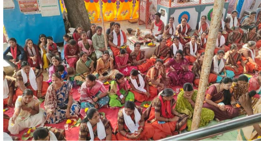
నారాయణపేట టౌన్, ఏప్రిల్ 27, మన సాక్షి

నారాయణపేట మండలం జూబిలీ హిల్స్ గ్రామంలో కన్యల పండుగగా కొనసాగుతున్న శ్రీ చౌడేశ్వరి మాత కుంభోత్సవ ఉత్సవాలు ఎంతో ఘనంగా కొనసాగుతున్నాయి. అమ్మవారి ఉత్సవాలలో భాగంగా సోమవారం అమ్మవారికి కుంకుమ పసుపు పంచామృత అభిషేకం మహా అలంకరణ నిర్వహించారు. అమ్మవారి ఆలయం ముందు మహిళల చేత వేదపండితులు వెంకటాద్రి మంత్రోచ్చారణలతో మహిళలచే సామూహిక కుంకుమార్చన చేపట్టారు. అనంతరం దార్శినిక సందేశాన్ని ఇస్తూ అధిపరాశక్తి చౌడేశ్వరి మాతకు కుంకుమార్చన చేపట్టడంతో మహిళల సకల కోరికలు నెరవేరడమే కాకుండా వర్షాలు సంపృద్ధిగా కురిసి పాడి వంటలతో ప్రజలు సుఖిక్షంగా ఉంటారని అన్నారు. అనంతరం ఆలయం నుండి జగ్గి బిందె కార్యక్రమానికి బయలుదేరి గ్రామ చివరలో ఉన్న చెరువు నుండి నీటి జనాలను తీసుకువచ్చి అమ్మవారికి అభిషేకం చేపట్టారు. 28వ మంగళవారం కుంభోత్సవ కార్యక్రమం పురందరులచే బిత్తి కార్యక్రమం చేపట్టేందుకు దేవాంగ సమాజం సభ్యులు అన్ని ఏర్పాట్లను పూర్తి చేసినట్లు తెలిపారు. ఈ కార్యక్రమంలో దేవాలయ కమిటీ సభ్యులు గ్రామస్థులు తదితరులు పాల్గొన్నారు.