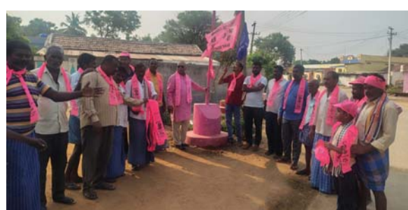
తుంగతుర్తి, ఏప్రిల్ 27, మన సాక్షి