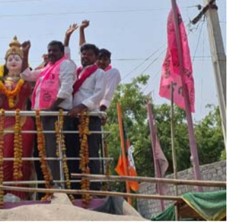
గుర్రంపాడు మండల కేంద్రంలో బిఆర్ఎస్ పార్టీ ఆవిర్భావ దినోత్సవ వేడుకలు అత్యంత వైభవంగా జరిగాయి.