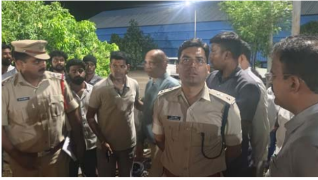
శంకర్పల్లి: ఏప్రిల్ 27: (మన సాక్షి):

రంగారెడ్డి జిల్లా శంకర్పల్లి మండలంలో విషాదకర ఘటన చోటుచేసుకుంది. ప్రముఖ నిర్మాణ సంస్థకు చెందిన ప్రాజెక్ట్ సోమవారం మధ్యాహ్నం సుమారు రెండున్నర గంటల సమయంలో ఈ ప్రమాదం సంభవించింది. ఒక్కసారిగా వీసిన తీవ్ర గాలుల ప్రభావంతో, భద్రతా ప్రమాణాలు పాటించినప్పటికీ భారీ క్రేన్ అదుపుతప్పి కూలిపోవడంతో అక్కడి పరిస్థితి విషాదకరంగా మారింది. ఈ ఘటనలో ఐదుగురు కార్మికులు మృతి చెందినట్లు సమాచారం. మరో 11 మందికి తీవ్రంగా గాయపడగా, వారిని సమీప ఆసుపత్రిలో అత్యవసర చికిత్స కోసం తరలించారు. గాయపడిన వారి పరిస్థితి విషమంగా ఉన్నట్లు వైద్యులు తెలిపారు. ప్రమాద తీవ్రతను దృష్టిలో ఉంచుకుంటే, మృతుల సంఖ్య పెరిగే అవకాశంపై ఆందోళన వ్యక్తంవుతోంది. ఈ ప్రాజెక్ట్ పనిచేస్తున్న కార్మికులు ఎక్కువగా ఇతర రాష్ట్రాలకు చెందినవారిగా తెలుస్తోంది. ప్రమాదం జరిగిన సమయంలో వాతావరణ పరిస్థితులు అకస్మాత్తుగా మారి గాలి వేగం తీవ్రంగా పెరగడం ప్రధాన కారణంగా