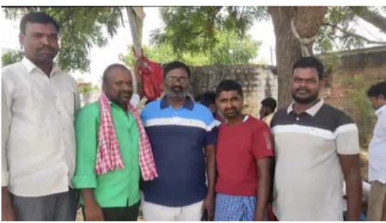
ఊర్జొండ, ఏప్రిల్ 28, మన సాక్షి: