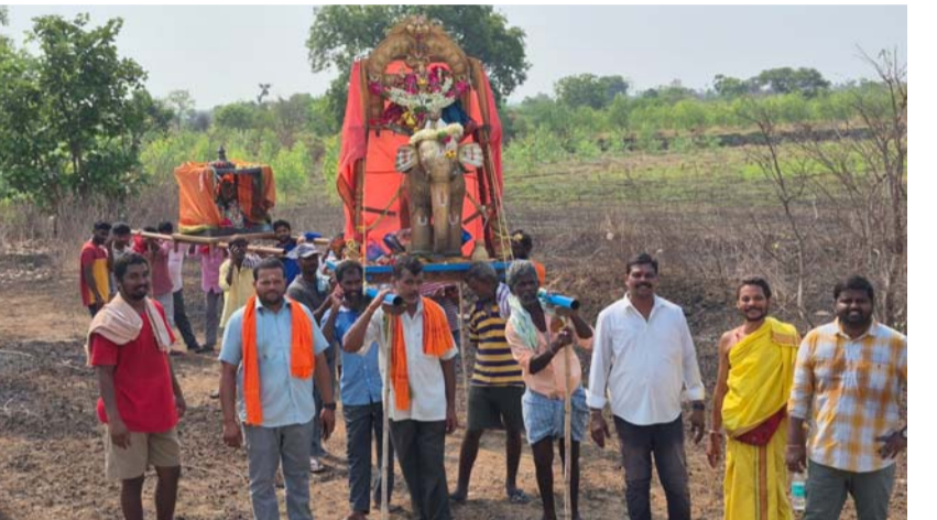
నర్సంపాలపేట, ఏప్రిల్ 27, మన సాక్షి: