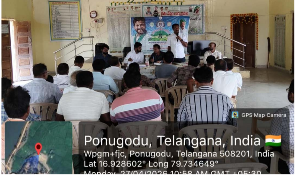
Ponugodu, Telangana, India Wpgm+fjc, Ponugodu, Telangana 508201, India Lat 16.928602° Long 79.734649° Monday, 27/04/2026 10:58 AM GMT +05:30