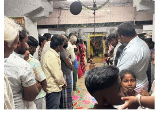
రామసముద్రం, ఏప్రిల్ 27, మన సాక్షి: