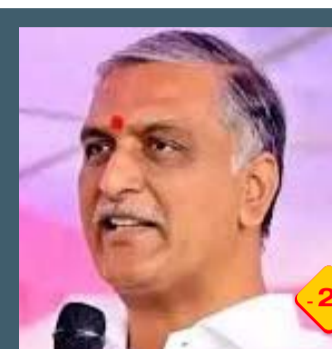
కేసీఆర్ క్యాంప్ కార్యాలయంపై దాడి రేవంత్ ఆదేశాలతోనే దాడికి వ్యూహం తీవ్రంగా ఖండించిన హరీష్ రావు

రూ.225 కోట్ల వ్యయంతో ఆలయ అభివృద్ధి అధ్యాత్మికత ఉట్టిపడేలా నిర్మాణాలు 6న బాసర ఆలయ అభివృద్ధి పనులకు సిఎం శంకుస్థాపన అధికారులతో అభివృద్ధి పనులపై సమీక్షించిన రేవంత్ రెడ్డి