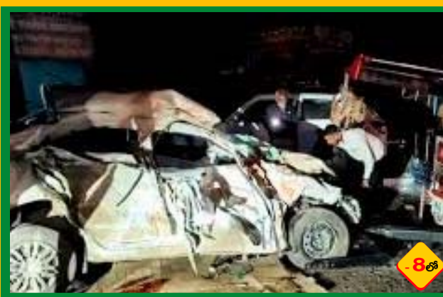
మహారాష్ట్రలో ఘోర ప్రమాదం