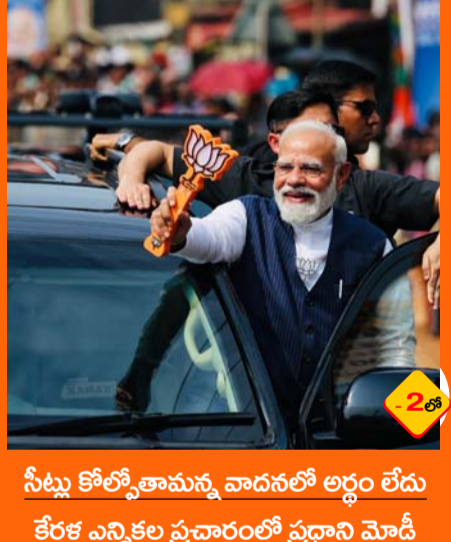
సీట్లు కోల్పోతామన్న వాదనలో లద్దం లేదు కేరళ ఎన్నికల ప్రచారంలో ప్రధాని మోడి