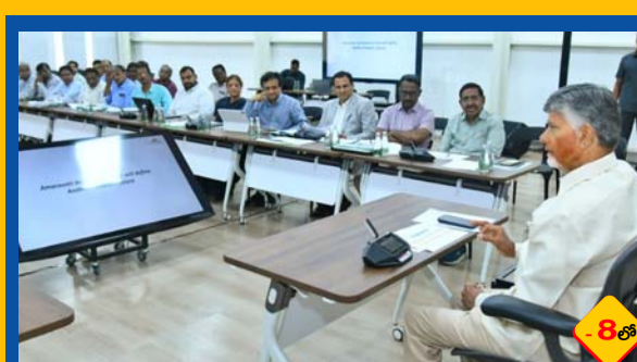
అమరావతి నిర్మాణంలో జాప్యం సహించను