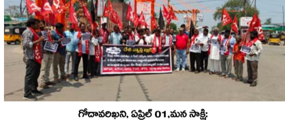
గోదావరిఖని, ఏప్రిల్ 01, మన సాక్షి: