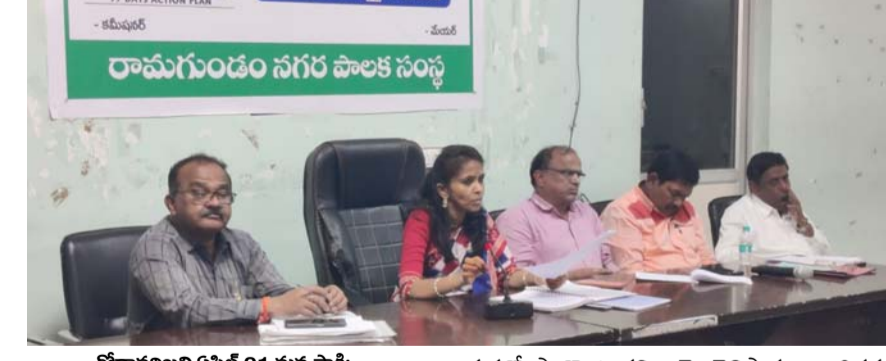
గోదావరిఖని, ఏప్రిల్ 01, మన సాక్షి:

ప్రజా పాలన -- ప్రగతి ప్రణాళిక 99 రోజుల కార్యచరణ లో భాగంగా ఏప్రిల్ 2, 2026 గురువారం ఉదయం 10 గంటలకు 60 డివిజన్లలో ఏక కాలంలో వార్డు సభలు నిర్వహిస్తున్నట్లు అదనపు కలెక్టర్ ( స్థానిక సంస్థలు ), రామగుండం నగర పాలక సంస్థ కమిషనర్ జె. అరుణ శ్రీ తెలిపారు. ప్రభుత్వ పథకాలు, వార్డు సమస్యలు గుర్తించి వాటి పరిష్కారాలపై చర్చించడం లక్ష్యంగా ప్రభుత్వ అధికారిక ప్రకారం ఈ వార్డు సభలు నిర్వహిస్తున్నట్లు ఆమె తెలిపారు. స్థానిక కార్పొరేటర్లు, ఇతర ప్రజా ప్రతినిధులు, వివిధ ప్రభుత్వ శాఖల అధికారులు, సిబ్బంది ఈ