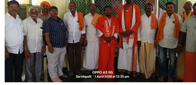
గండేపల్లి,ఏప్రిల్ 01,మన సాక్షి