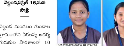
వెల్లండ్, ఏప్రిల్ 16, మన సాక్షి

సీబీఎస్ఈ 10వ తరగతి పరీక్ష ఫలితాల్లో విజయభేరి..!