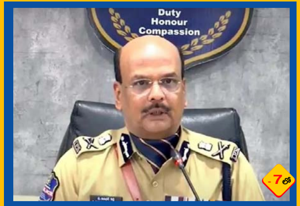
డిజిపి ఎదుట లొంగిపోయిన కేశాలు