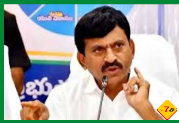
పేదల ప్రభుత్వంపై ప్రతిపక్షాల బురద రాజకీయం