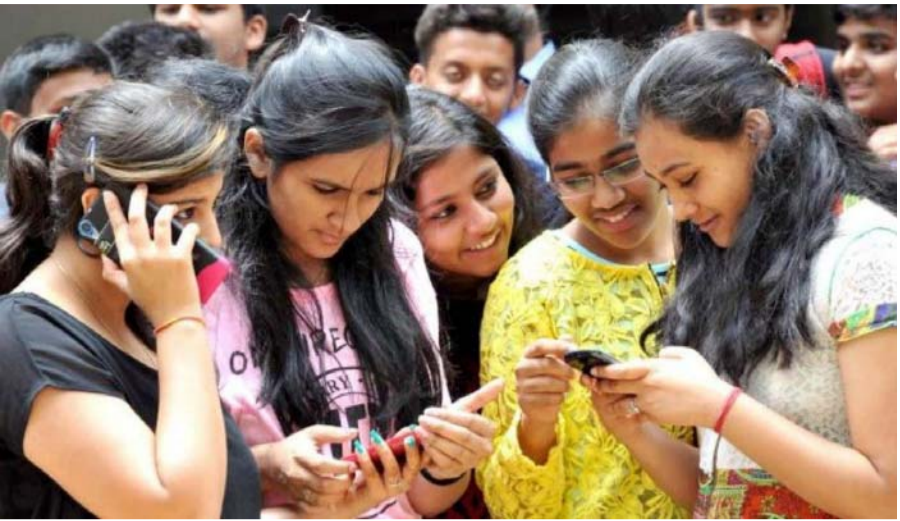
తెలిపారు. అకడమిక్ ఎక్సలెన్స్ కోసం అందరూ కలిసి ఫలితాలు సాధించారు. ద్వితీయ సంచిత్రం కృషి చేయడం ఫలితం ప్రశంసించారు. ఇంటర్ ఫలితాల్లో అమ్మాయిలు కంటే అమ్మాయిలు మెరుగైన ప్రదర్శన సంచిత్రం అమ్మాయిలు పాస్ శాతం

అమరావతి, ఏప్రిల్ 15 (ఆర్ఎన్ఎన్): ఏపీ ఇంటర్ ఫలితాలు విడుదలయ్యాయి. బుధవారం ఉదయం మంత్రి నారా లోకేశ్ ఫలితాలను విడుదల చేశారు. ఈ ఏడాది ఇంటర్ ఫలితాల్లో రికార్డు స్థాయిలో ఉత్తీర్ణత సమాధి అయ్యింది. గత 12 ఏళ్లలో అత్యధికంగా మొదటి సంచిత్రం విద్యార్థులు 77 శాతం పాస్ అయ్యారు. రెండో సంచిత్రం విద్యార్థులు 81 శాతం పాస్ అయ్యారు. రెండో అత్యుత్తమ ఫలితాలను సాధించారు. విద్యార్థులు తమ ఫలితాలను వెబ్ సైట్ లో చూసుకోవచ్చు. మెన్ బేజ్ నెంబర్ 9552300009 నంబర్ కు వాట్సాప్ లో పంపితే కూడా ఫలితాలు అందుకోవచ్చు అంటారు. ప్రభుత్వ ప్రధాన కార్యదర్శి ఈ ఏడాది మెరుగైన ఫలితాలు వచ్చాయి. గవర్నమెంట్ జూనియర్ కాలేజీల్లో మొదటి సంచిత్రం 54 శాతం ఉత్తీర్ణత సమాధింది. రెండో సంచిత్రం జీసీసీలో 68 శాతం పాస్ అయ్యారు. ఇది గత 12 ఏళ్లలో అత్యధిక ఉత్తీర్ణత సమాధి అయింది. విద్యార్థులు, డిప్యూటీ, లెక్చర్లర్ల సమిష్టి కృషి వల్లే ఈ ఫలితాలు వచ్చాయని అధికారులు