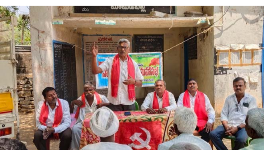
తుంగతుర్తి, ఏప్రిల్ 15, మన సాక్షి