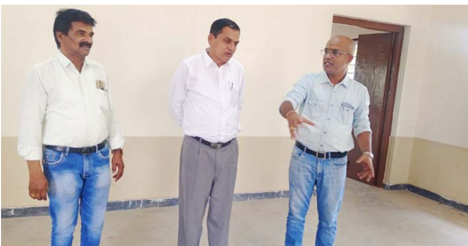
పోస్టుల వివరాలను ప్రభుత్వానికి అందజేసినట్లు తెలిపారు. దివంగత ముఖ్యమంత్రి ఎన్టీఆర్ హయాంలో లైబ్రరీ పోస్టులు భర్తీ చేసారని అప్పటి