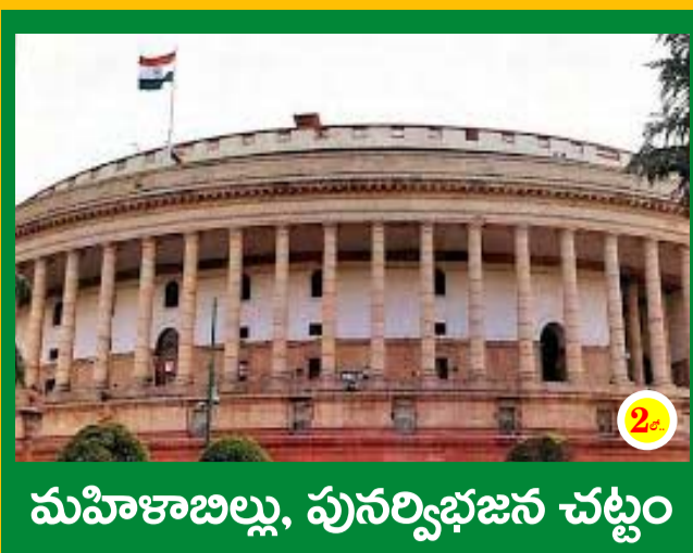
మహిళాబిల్లు, పునర్విభజన చట్టం