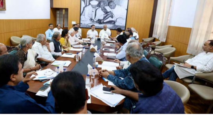
ఓటీసీ సమాధి కాంగ్రెస్ పార్టీ వైఖరిని తెలియజేశారు. డీలిమిటేషన్ పై ఇండియా కూటమి పార్టీలు ఏకతాటిపై ఉన్నాయని తెలిపారు. రాజకీయ ప్రయోజనాల కోసం హడావిడిగా కేంద్ర ప్రభుత్వం ఈ బిల్లును ప్రవేశ పెడుతోందని ఆరోపించారు. డీలిమిటేషన్ వ్యతిరేకంగా పార్లమెంట్ లో సమిష్టిగా పోరాడుతామని తెలిపారు. మహిళా రిజర్వేషన్ బిల్లుకు ఇండియా కూటమి అనుకూలంగానే ఉందని.. కానీ దానిని ఉన్నాయని కాంగ్రెస్ అభ్యంతరాలు ఖర్చు చేస్తోందని ఆరోపించారు. మహిళా రిజర్వేషన్ బిల్లుకు ఇండియా కూటమి మద్దతు ఇస్తుందని తెలిపారు. మహిళా రిజర్వేషన్ పై అనాధైనా ఇనాధైనా కాంగ్రెస్ ది ఒకటి స్టాండ్ అని పేర్కొన్నారు. డీలిమిటేషన్ పేరుతో కేంద్ర ప్రభుత్వం చేస్తోన్న ట్రిక్ లులకు వ్యతిరేకమని.. మహిళా రిజర్వేషన్ అంటూ దొంగ దారిలో డీలిమిటేషన్ అమలు చేసేందుకు కేంద్ర ప్రభుత్వం కుట్ర చేస్తోందని ఆరోపించారు. డీలిమిటేషన్ తీవ్రంగా వ్యతిరేకిస్తున్నామని.. పార్లమెంట్ లో ఈ బిల్లుకు వ్యతిరేకంగా ఆలోచించామని నియోజకవర్గాల

న్యూఢిల్లీ: పార్లమెంట్ లో కేంద్ర ప్రభుత్వం ప్రవేశపెట్టిన మహిళా రిజర్వేషన్ బిల్లు, డీలిమిటేషన్ బిల్లుపై కాంగ్రెస్ సంచలన నిర్ణయం తీసుకుంది. మహిళా రిజర్వేషన్ బిల్లుకు మద్దతు తెలిపిన కాంగ్రెస్.. డీలిమిటేషన్ బిల్లును మాత్రం వ్యతిరేకిస్తామని ప్రకటించింది. కాగా, దేశవ్యాప్తంగా నియోజక వర్గాల పునర్విభజన, మహిళా రిజర్వేషన్ బిల్లులకు రంగం సిద్ధమైంది. ఈ రెండు బిల్లులను ఏప్రిల్ 16 నుంచి ప్రారంభం కానున్న పార్లమెంట్ ప్రత్యేక సమావేశాల్లో ప్రవేశపెట్టేందుకు కేంద్రం రెడీ అయింది.