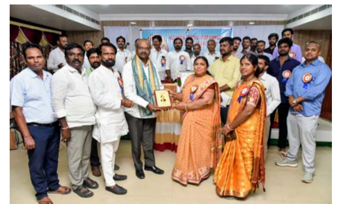
నల్లగొండ, ఏప్రిల్ 12, మన సాక్షి:

ఎస్సీ ఎస్టీ పోస్టల్ ఎంప్లాయిస్ యూనియన్ జిల్లా సూతన కమిటీ ఎంపిక