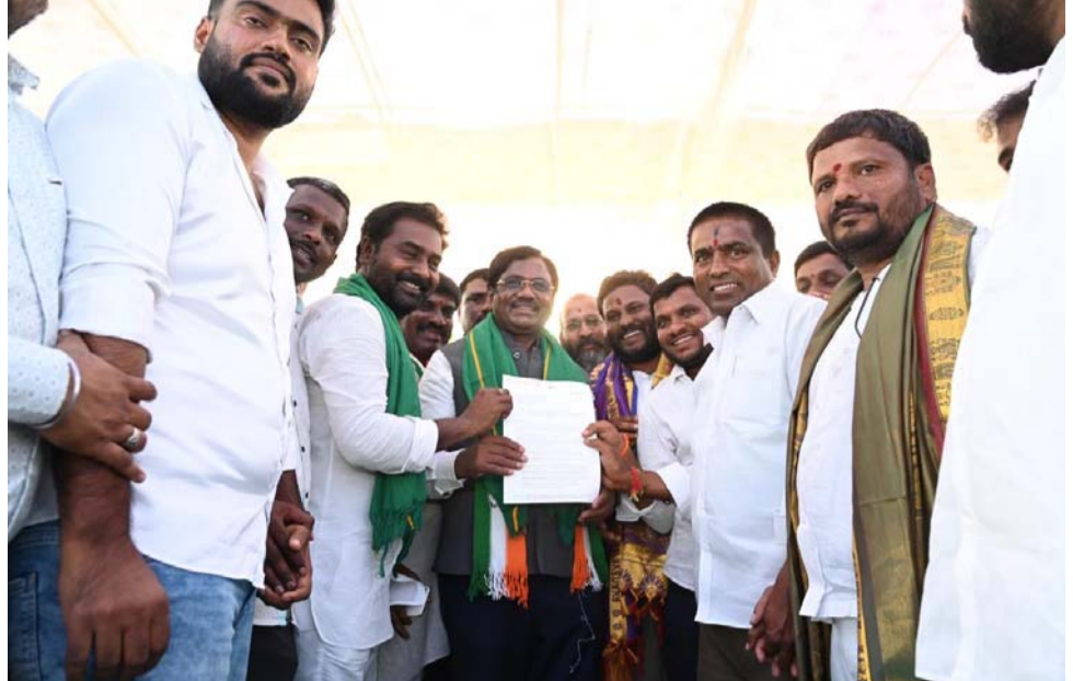
పటాన్ చెరు, ఏప్రిల్ 12, మన సాక్షి: