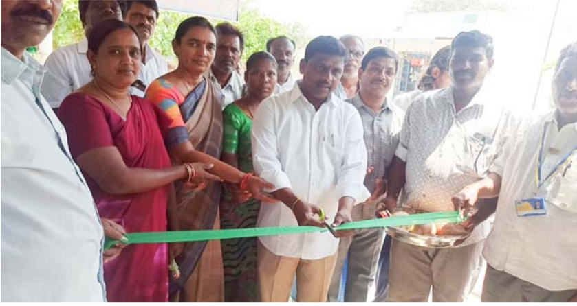
గలదేపల్లి, ఏప్రిల్ 12, మన సాక్షి: