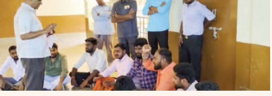
నల్లగొండ మార్చి 30 మన సాక్షి