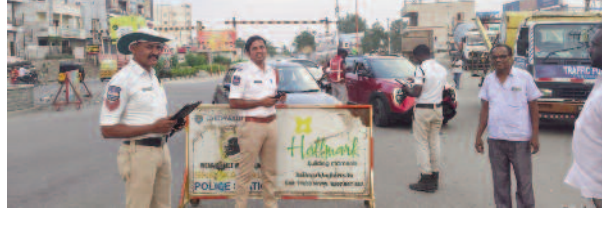
శంకర్పల్లి మార్చి 30: (మన సాక్షి):