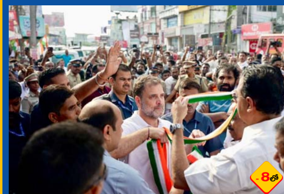
కేరళలో ఎల్డిఎఫ్లో బిజెపి కుమ్ముక్కు