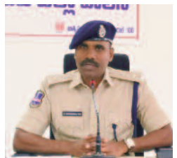
సూర్యాపేట, మార్చి 02, మన సాక్షి: