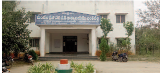
చింతపల్లి, మార్చి 01, మన సాక్షి: