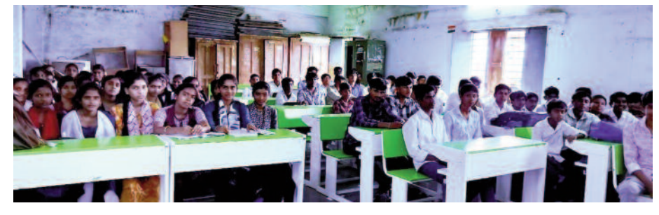
కంగ్లి, మార్చి 01, మన సాక్షి:

పదో తరగతి పరీక్షలో ప్రతి విద్యార్థి ఉత్తీర్ణుడు కావాలని, కంగ్లి మండలంలో శతశాతం ఉత్తీర్ణత సాధించాలని ప్రధాన లక్ష్యంతో అన్ని ఉన్నత పాఠశాలల్లో సమగ్ర కార్యక్రమ ప్రణాళికను అమలు చేస్తున్నారు. ప్రతిరోజూ ఉదయం, సాయంత్రం చదువుకునే విధంగా ఫోన్ చేసి వారిని ప్రోత్సహిస్తున్నారు. మార్చి 14 నుంచి ఏప్రిల్ 16వ తేదీ వరకు పది పరీక్షలు జరుగుతున్నాయి. పాఠశాల తరగతులకు అదనంగా రెండు గంటలపాటు ప్రత్యేక పునశ్చరణ తరగతులు నిర్వహిస్తున్నారు. ఉపాధ్యాయులు విద్యార్థుల సందేహాలను ఎప్పటికప్పుడూ నివృత్తి చేస్తున్నారు. విద్యార్థులకు పరీక్షలపై భయాంక్ష దోళనలు తొలగిస్తున్నారు. విద్యార్థులపై తల్లిదండ్రులు కూడా దృష్టి సారించాలని, ఇంటి వద్ద చదువుకునేలా చూడాలని చెప్పన్నారు.