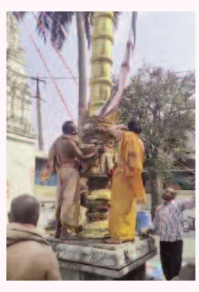
రామనమద్రం, మార్చి 01, మన సాక్షి:

రామనమద్రం మండల కేంద్రంలోని దిగువ పేటలో కొలువైన శ్రీ ప్రసన్న పార్వతీ సమేత చంద్రశేఖర స్వామి బ్రహ్మోత్సవాలు భాగంగా ఆదివారం అలయ అర్చకులు బాలాస్వామి అర్చకులు బృందం వారిచే వేద మంత్రాలతో ధ్వజారోహణం ప్రారంభించారు. ఉదయం స్వామి వారికి అభిషేకాలు, అర్చనలు ఘనంగా నిర్వహించారు. స్వామి వారిని భక్తులకు దర్శనం కల్పించి తీర్థ ప్రసాదాలు అందజేశారు.