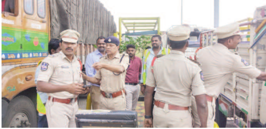
మిర్యాలగూడ, మార్చి 01, మన సాక్షి: