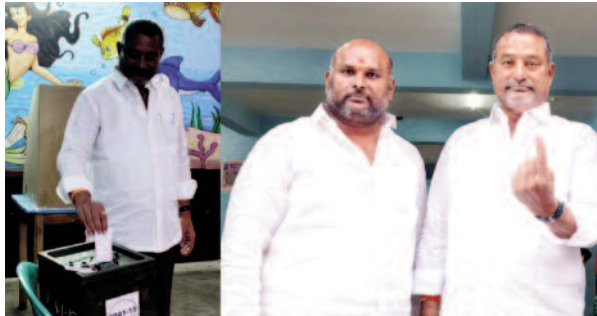
మిర్యాలగూడ, ఫిబ్రవరి 11, మన సాక్షి.