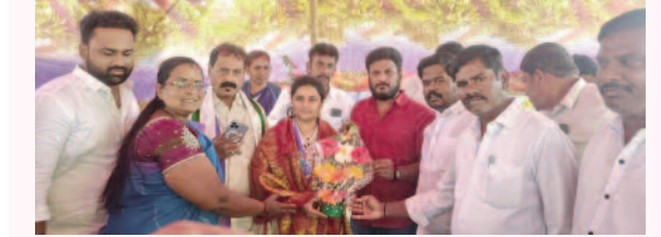
మదనపల్లి, ఫిబ్రవరి 11, మన సాక్షి