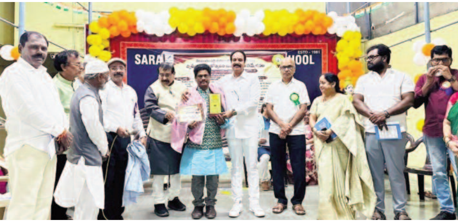
శేరిలింగంపల్లి 11 ఫిబ్రవరి మన సాక్షి