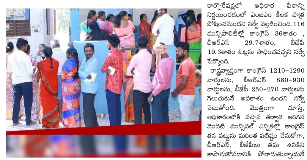
అత్యధిక స్థానాల్లో కాంగ్రెస్ గెలుపు 7 కార్పొరేషన్లలో 5 కాంగ్రెస్, 2 బిజెపి గెలుపు పలుచోట్ల ఎంపిలకు కీలకం కానుందని వెల్లడి