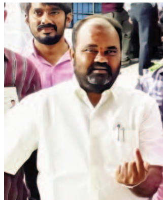
నల్లగొండ ఫిబ్రవరి 11 మన సాక్షి.

నల్లగొండ కార్పొరేషన్ కు బుధవారం జరిగిన పోలింగ్ ప్రశాంతంగా ముగిసింది. మొత్తం 48 డివిజన్లకు అధికారులు పోలింగ్ నిర్వహించారు. పోలింగ్ కట్టుదిట్టమైన భద్రత చర్యలు చేపట్టడంతో ఎటువంటి అవాంఛనీయ సంఘటనలు జరగకుండా సాయంత్రం ఐదు గంటలకు పోలింగ్ ముగిసింది. దీంతో అధికారులు ఊపిరి పీల్చుకున్నారు. ఉదయం ఏడు గంటలకు మండకుడిగా ప్రారంభమైన పోలింగ్ 11 గంటలకు