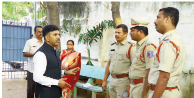
నల్లగొండ, ఫిబ్రవరి 11, మన సాక్షి