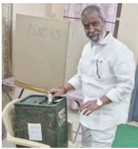
అందోలు, ఫిబ్రవరి 11, మనసాక్షి:

రాష్ట్రంలో మెజార్టీ ఓటర్లు కాంగ్రెస్ వైపే ఉన్నారని రాష్ట్ర వైద్య ఆరోగ్యశాఖా మంత్రి దామోదర్ రాజనర్సింహ అన్నారు. బుధవారం జోగిపేట మార్కెట్ కమిటీలోని పోలింగ్ కేంద్రంలో ఓటు హక్కు వినియోగించుకున్నారు. ఈ సందర్భంగా మంత్రి స్థానిక విలేకరులతో మాట్లాడారు. రాష్ట్రంలోని కాంగ్రెస్ పార్టీ ప్రభుత్వం పట్ల ప్రజలు పూర్తి విశ్వాసంతో ఉన్నారన్నారు. సీఎం