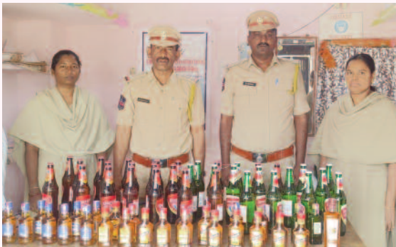
నారాయణపేట టౌన్, ఫిబ్రవరి 11 మనసాక్షి:-