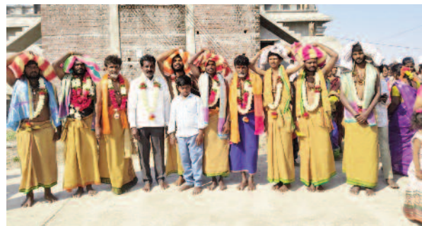
బషీరబాద్, ఫిబ్రవరి 11 మన సాక్షి: