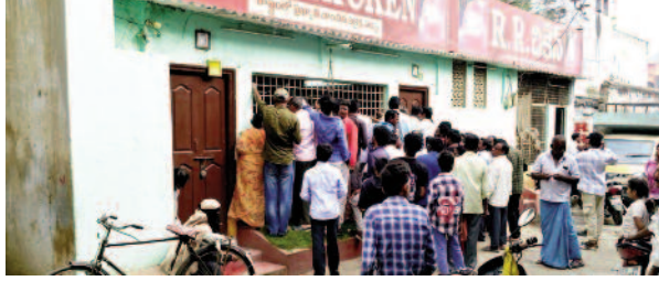
మిర్యాలగూడ, ఫిబ్రవరి 11, మన సాక్షి :

మున్సిపల్ ఎన్నికల్లో ఓటర్లను ప్రలోభాలకు గురి చేసేందుకు రాజకీయ పార్టీలు చికెన్ చిట్టె లను పంచారు. పలు వార్డులలో చికెన్ చిట్టెలను ఇంటింటికి పంపడంతో వారంతా చికెన్ సెంటర్ వద్దకు గుంపులుగా చేరుకున్నారు. దాంతో చికెన్ సెంటర్ యజమాని తలుపులు మూసి కిటికీలోనుంచి చికెన్ చిట్టెలకు చికెన్ అందజేశారు.