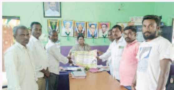
బహిరాబాద్, జనవరి 11, మన సాక్షి