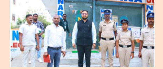
సూర్యాపేట, ఫిబ్రవరి 25, మన సాక్షి:

సూర్యాపేట నారాయణ జూనియర్ కళాశాలలో ఇంటర్మీడియట్ పరీక్షా కేంద్రాన్ని జిల్లా కలెక్టర్ తేజస్ నంద్ లాల్ పవార్ బుధవారం తనిఖీ చేశారు. పరీక్షా కేంద్రంలోని పలు తరగతి గదులలో పరీక్ష జరుగుతున్న తీరును కలెక్టర్ పరిశీలించారు. పరీక్షా కేంద్రంలో కల్పించిన సౌకర్యాలను అడిగి అత్యధి పరిసరాలను పరిశీలించారు. సీసీ కెమెరాల నిఘాతో ప్రశ్నాపత్రాలను ఓపెన్ చేసి ఇన్విజిలెటర్లకు అందజేసే గదిని కలెక్టర్ పరిశీలించారు. పరీక్షా కేంద్రంలో పరీక్షల నిర్వహణ సజావుగా ఉండేలా చర్యలు చేపట్టాలని, పరీక్షల నిర్వహణకు సంబంధించిన పలు సూచనలను కలెక్టర్ చేశారు.