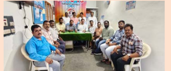
సూర్యాపేట, ఫిబ్రవరి 25, మన సాక్షి: