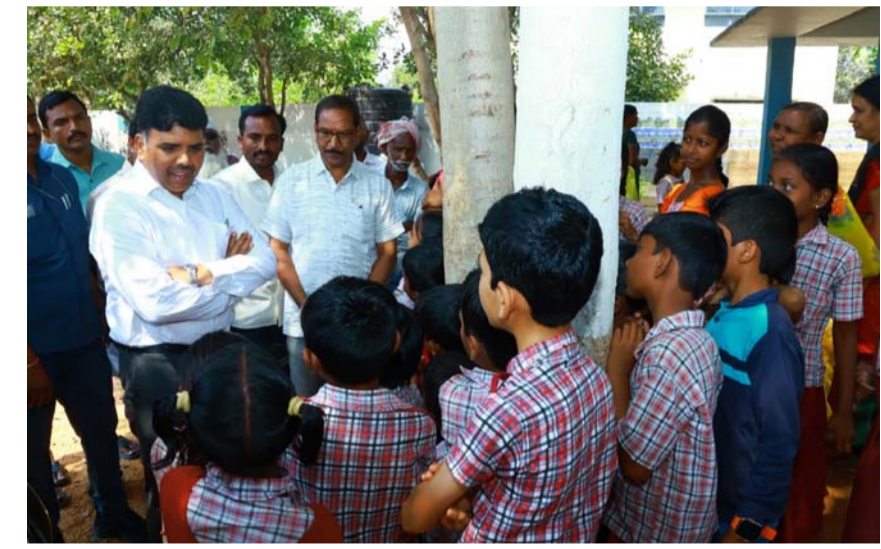
హలియా, ఫిబ్రవరి 25, మన సాక్షి: