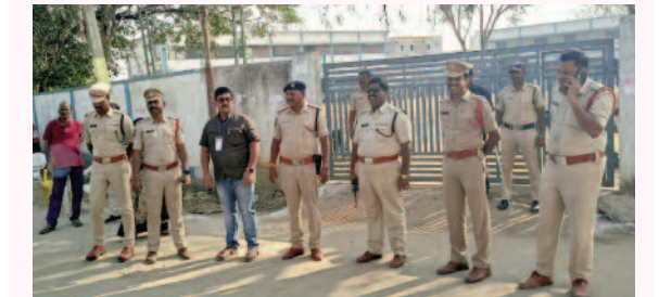
శివంపేట, డిసెంబర్ 17, మన సాక్షి