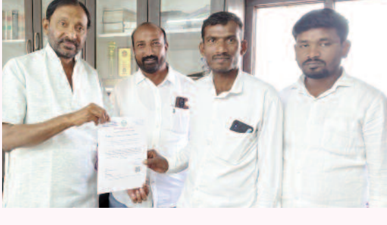
మిర్యాలగూడ, డిసెంబర్ 17, మన సాక్షి