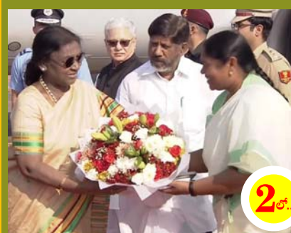
హైదరాబాద్ కు వేరుకున్న రాష్ట్రపతి ద్రౌపది ముర్ముకు స్వాగతం పలికిన గవర్నర్, డిప్యూటీ సీఎం