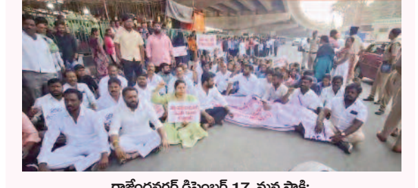
రాజేంద్రనగర్, డిసెంబర్ 17, మన సాక్షి

శంషాబాద్ మున్సిపాలిటీని చార్జినార్ జోన్ లో కల్వవద్దని ప్రధాన రోడ్డుపై భారీగా జేపీసీ నాయకులు బైరాయింది ధర్నా నిర్వహించారు. చార్జినార్ వద్ద శంషాబాద్ ముద్దు అంటూ నినాదాలు చేశారు. దీంతో రహదారిపై భారీగా రెండు నుంచి మూడు కిలోమీటర్ల వరకు ట్రాఫిక్ జాం ఏర్పడింది. రంగంలోకి దిగిన ఆర్డీబి పోలీసులు జేపీసీ నాయకులను అరెస్టు చేసి ట్రాఫిక్ ను క్లియర్ చేశారు.