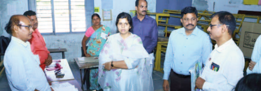
నల్లగొండ, డిసెంబర్ 17, మన సాక్షి