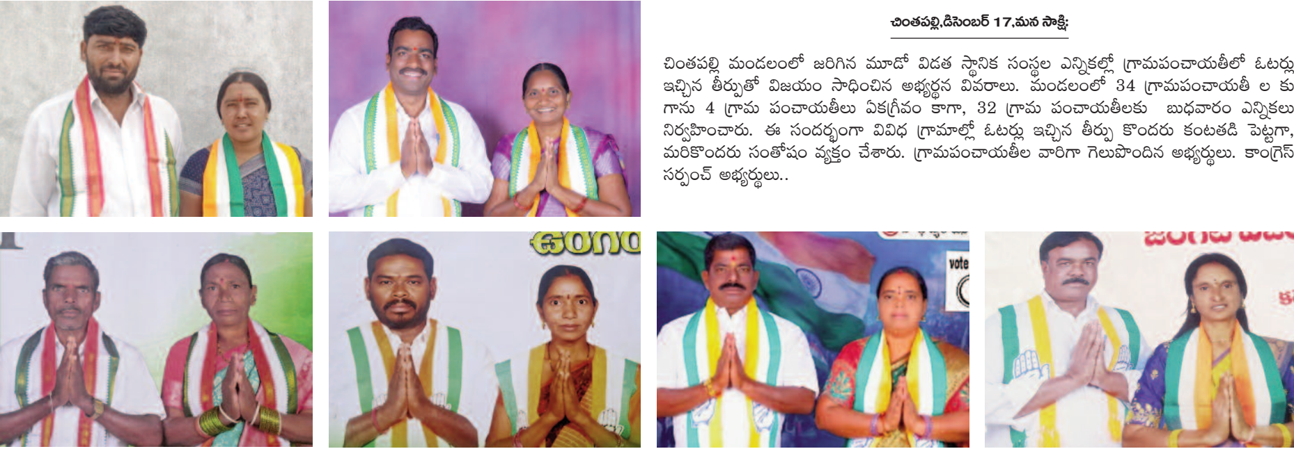
చింతపల్లి,డిసెంబర్ 17,మన సాక్షి:

చింతపల్లి మండలంలో జరిగిన మూడో విడత స్థానిక సంస్థల ఎన్నికల్లో గ్రామపంచాయతీలో ఓటర్లు ఇచ్చిన తీర్పుతో విజయం సాధించిన అభ్యర్థుల వివరాలు. మండలంలో 34 గ్రామపంచాయతీ ల కు గాను 4 గ్రామ పంచాయతీలు ఏకగ్రీవం కాగా, 32 గ్రామ పంచాయతీలకు బుధవారం ఎన్నికలు నిర్వహించారు. ఈ సందర్భంగా వివిధ గ్రామాల్లో ఓటర్లు ఇచ్చిన తీర్పు కొందరు కంటతడి పెట్టగా, మరికొందరు సంతోషం వ్యక్తం చేశారు. గ్రామపంచాయతీల వారిగా గెలుపొందిన అభ్యర్థులు. కాంగ్రెస్ సర్పంచ్ అభ్యర్థులు..