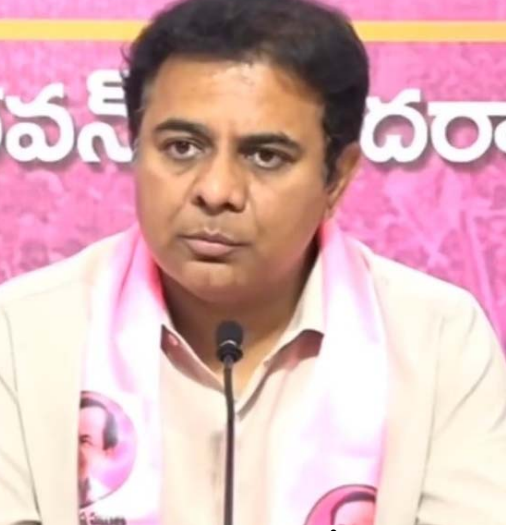
అలంపూర్ వరకు ప్రతి గులాబీ సైనికుడి కళ్లలో కనిపించిన పాఠం. కాంగ్రెస్ పార్టీ మోసాట, వైఫల్యాలపై తెలంగాణ పల్లె మోగించిన 'జంగ్ సైరస్' ఇది. రేచంద్రారెడ్డి రెండేళ్లలో వచ్చిన పల్లెల్లో చిచ్చు పెట్టారు.

హైదరాబాద్, మనసాక్షి: రాష్ట్రంలో జరిగిన పంచాయితీ ఎన్నికల్లో ప్రజల తీర్పుతో కాంగ్రెస్ పార్టీ పతనం ప్రారంభమైందని భారతీయ కాంగ్రెస్ అధ్యక్షుడు కేటీఆర్ పేర్కొన్నారు. రానున్న ప్రతి ఎన్నికల్లో కాంగ్రెస్కు మరింత పతనం తప్పదన్నారు. ఈ మేరకు బుద్వారం ఆయన ప్రకటన విడుదల చేశారు. "ఆరు గ్యారంటీలు, 420 హామీలు ఆశ చూపించి కాంగ్రెస్ అధికారంలోకి వచ్చింది. వాటిని అమలు చేయకుండా ప్రతి ఒక్కరినీ మోసం చేసింది. అందుకే పంచాయితీ ఎన్నికల్లో ఆ పార్టీకి ప్రజలు గుణపాఠం చెప్పారు. ఎన్నికలకు ముందు ప్రధాన ప్రతిపక్షం గురించి కాంగ్రెస్ నేతలు ఇష్టం వచ్చినట్లు మాట్లాడారు. ప్రజలు ఇచ్చిన పంచాయితీ ఎన్నికల తీర్పును చూసి ఆ పార్టీ వాస్తవాల తెలుసుకోవాలి. ఎప్పుడైనా ప్రజల తరఫున పోరాటం చేసేది భారతీయ కాంగ్రెస్ అని ప్రయోగించాల్సి ఉంది. బల ప్రయోగం వల్ల ఎదురైన భారీగా పంచాయితీలను భారతీయ కాంగ్రెస్ కట్టపెట్టారు. ఇది ఆదిలాబాద్ నుంచి