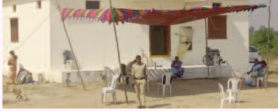
చింతపల్లి, డిసెంబర్ 17, మన సాక్షి