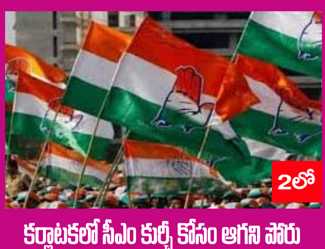
కర్ణాటకలో సీఎం కుల్శ్రీ కోసం ఆగస్తి పోరు