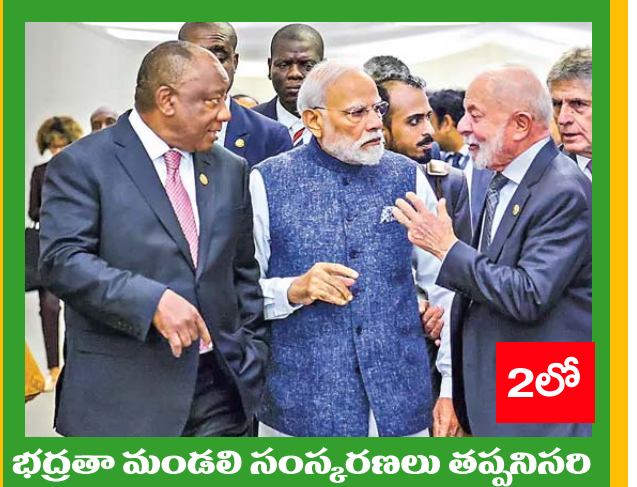
భద్రతా మంత్రి సంస్కరణలు తప్పనిసరి

నల్గొండ హైదరాబాద్ సంపుటి : 4. సంచిక : 55 సోమవారం 24 నవంబర్ 2025 పేజీలు 8 వెల: రూ. 1.00 epaper.manasakshi.in