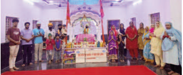
చిట్టాల, అక్టోబర్ 26, మన సాక్షి: