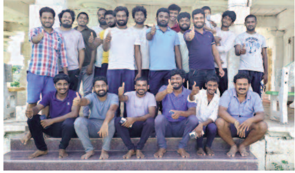
నడిగూడెం 26, మన సాక్షి