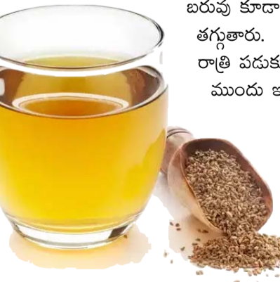
గోరువెచ్చని నీటిలో వాము పొడర్ని కలిపి తాగడం వల్ల జీర్ణ సమస్యలు దూరమవుతాయి.

ఆస్తమా, టీబీ, క్షయ, అబ్స్ట్రక్టివ్ పల్మనరీ డిసీజ్, ప్లీవ్ ఆప్షియా, న్యూ మోనియా ఇన్ఫెక్షన్, శ్వాస ఆడకపోవడం, రెస్ట్ లేకపోవడం, అలసట వంటివి ఉంటాయి. చాలా సందర్భాల్లో ఇన్ఫెక్షన్ అనేది గాలితో వస్తుంది. గాలిని పీలుస్తారు. క్రమంగా ఊపిరితిత్తులపై ఎఫెక్ట్ పడి న్యూమోనియా వస్తుంది. ఎప్పుడు సమస్య.. సమస్య రావడానికి చాలా కారణాలు ఉన్నాయి. ధూమపానం, కాలుష్యం, శ్వాసకోశ ఇన్ఫెక్షన్లు అన్ని దేశాల్లో ప్రజలను ప్రభావితం చేస్తాయి. అయితే, అవగాహన లేకపోవడం, సరైన రెగ్యులర్గా చేస్తే బరువు కూడా తగ్గుతారు. రాత్రి పడుకునే ముందు ఇలా సాధారణంగా కడుపు ఉబ్బరం, త్రేస్సులు, జీర్ణ సమస్యల్ని దూరం చేయడంలో ఈ వాము వాటర్ బాగా హెల్ప్ చేస్తాయి. రాత్రి వాముని పడుకునే ముందు తీసుకోవాలి. ఇందులో ముందుగా వాముని పొడిలా చేయాలి. తర్వాత ఆ వాముని టీ