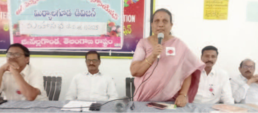
మిర్యాలగూడ, అక్టోబర్ 26, మన సాక్షి