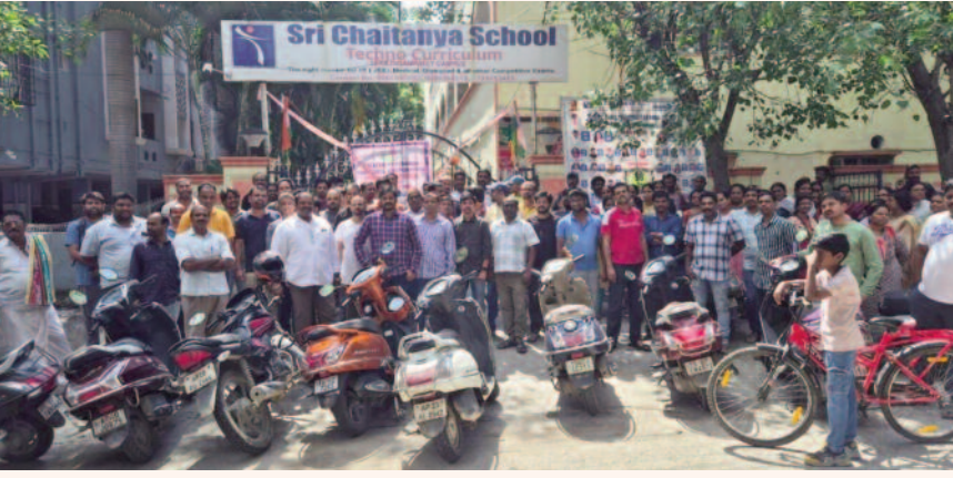
శేరిలింగంపల్లి, అక్టోబర్ 26, మన సాక్షి