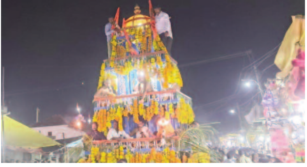
భీంకల్, అక్టోబర్ 26, మన సాక్షి:

భీంకల్ మండలం చెంగల్ గ్రామంలో శ్రీశ్రీ లక్ష్మీ వేంకటేశ్వర స్వామి 25వ వార్షిక బ్రహ్మోత్సవాలు ఘనంగా నిర్వహించారు. శనివారం యజ్ఞము కుంకుమార్చన నిర్వహించారు ఇందులో భక్తులు అధికసంఖ్యలో పాల్గొన్నారు. ఆదివారం ఉ 10:00 గంటలకు శ్రీ లక్ష్మీ వేంకటేశ్వర స్వామి వారి కళ్యాణము తరువాత స్వామివారి రథోత్సవము సమయం 7:30 రాత్రి ఆలయం నుండి బయలుదేరి ఉరి చివర ఉన్న బస్టాండ్ వరకు వెళ్లి మళ్ళీ స్వామి వారి ఆలయం వరకు చేరుకుంది. గోవిందా గోవిందా అనే స్మరణలతో మారుమోగింది ఇందులో యువకులు, మహిళలు, చిన్నలు పెద్దలు సందఖ్యలో పాల్గొన్నారు నిర్వహించారు అలాగే అన్నదాన కార్యక్రమం నిర్వహించారు. ఈ ఉత్సవ కార్యక్రమంలో శ్రీశ్రీ లక్ష్మీ వేంకటేశ్వర స్వామి దేవాలయ కమిటీ, గ్రామాభివృద్ధి కమిటీ, గ్రామ ప్రజలు పాల్గొన్నారు.