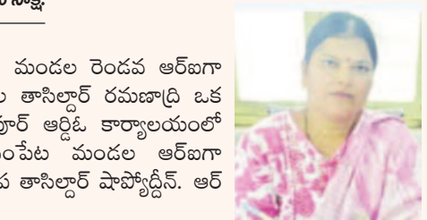
శివంపేట, అక్టోబర్ 26, మన సాక్షి: