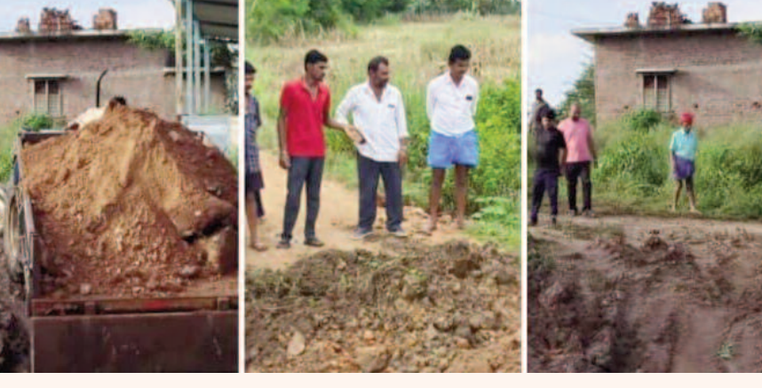
వెల్లం, అక్టోబర్ 26, మన సాక్షి